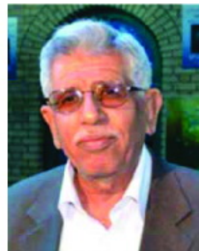
الكاتب العراقي محمد خضير

الراحل له من النصوص المهمة الكثير كما حصل مع رواية حصلت عنوان (تخطيطات بالفحم الأسود). وكان قد بدأ كتابتها عام 1952 ويبدو أنها قد اكتملت لأنها لم تجد لها أي أصول في مسوداته ولم أعرف سبب إهماله إيها، ومن الجدير بالذكر - والكلام للقاص - أن هذه هي الأكل من بين القصص وقد نشرت في الدوريات العراقية. وأخيراً تمنى القاص محمد خضير أن تجد مؤلفات الراحل تورا لها في مطابعتنا !! أما عناوين الجاهل بتاريخه فهي: «رؤوسكو وامرأة الجاحظ، بتاريخه 2001»، و«تلك الليلة»، و«الوجه المفقود» بتاريخه 3/ 11/ 2005 و«الضحك من خلال الدموع» بتاريخه 2/ 28/ 1993 و«الرجل البدائي» بتاريخه 7/ 2007. وقد قام القاص محمد خضير بتوليع الكتاب في نهاية الجلسة الاستذكارية الأولى والخاصة بالراحل القاص الراحل محمود عبد الوهاب والتي بدأت وقائعها صباح يوم السابع من كانون الأول الماضي في مقر اتحاد أدباء وكتاب.