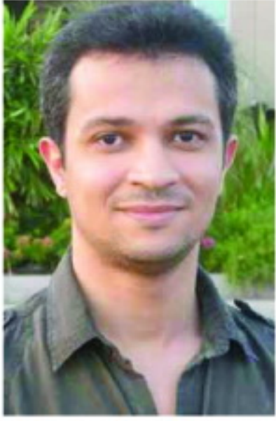
علوان: الرواية نتاج مجتمعها

كفي ترى للمشهد الروائي السعودي وما تقييمك لهذا الزخم الذي أنجز في السنوات الأخيرة تحديداً وصعود نجم الكثير من روائييه؟ أجده واعداً وممتلكاً للقوالب الإبداعية. فالمجتمع في حالة تغير دائم وسريع مما يضعه أمام الكثير من أسئلة التحولات التي تجد فيها الرواية مجالاً للطرح والتعبير والمناقشة. والمنجز السعودي المتزايد من الروايات ليس إلا مصادقاً لجاذبية الرواية في تناول الإشكالات الفلسفية والوجودية والاجتماعية الذي يسببه تسارع وتيرة التغيير في المجتمع. هل ترى أن الحركة النقدية في المملكة تتابع حركة الإبداع بشكل جيد؟ التجاوب النقدي أقل من المأمول، والتناول الإعلامي له أيضاً ضعيف. كثير من النقاد السعوديين وهم أكاديميون في الأصل وبالتالي يفضلون الانجاب على مشاريع بحثية ذات عائد أكاديمي مباشر. والنقابة من النقاد لا يجدون عائداً صحفياً أو إعلامياً يوازي الجهد الذي بذلوه في نقد رواية أو تحليل خطاب أدبي، وبالتالي يترددون في الكتابة النقدية فصيحة تنتشر على صفحات الثقافة في الصحف.